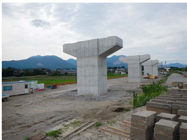
大安高架橋南下部工事