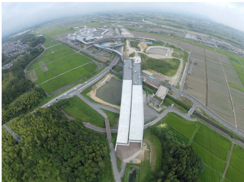
東員IC(仮称)工事状況