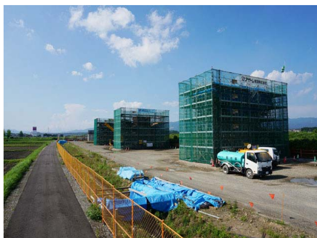
員弁大安高架橋中下部工事