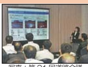
写真：第31回道路会議

▶ 道路の計画・設計から施工、維持管理にわたる幅広い分野の最新の研究成果や現場での優れた取組が報告されます。 ▶ 各会場では報告内容を題材に活発な意見交換や討議が行われます。