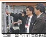
写真：第31回道路会議